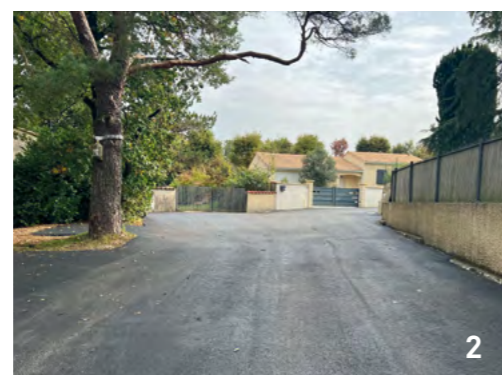
En images, quelques travaux réalisés lors du second semestre 2024